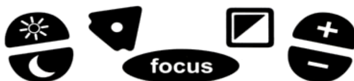
Εικόνα 1: Πίνακας Ελέγχου

Πίνακας Ελέγχου: Ο Πίνακας Ελέγχου βρίσκεται στο μπροστινό μέρος της επιφάνειας μεγέθυνσης για να διευκολύνει τον χρήστη στην αλλαγή χαρακτηριστικών μεγέθυνσης.